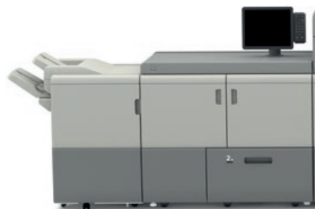
Presse numérique Ricoh 9210

Grapho12 assure une productivité et une compétitivité maximales grâce à sa nouvelle presse offset Komori 8 groupes !