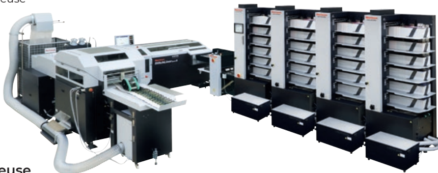
Assembleuse-piqueuse Horizon Mark III

Ce modèle de plieuse encarteuse est la dernière-née du concept Stitch-Liner du constructeur Horizon. Elle réunit en une seule et même machine les étapes de pliage, de brochage et de coupe trilatérale propres aux systèmes d'encartage traditionnel. Elle permet des productions de brochures de 8 à 96 pages jusqu'à 6000 exemplaires/heure.