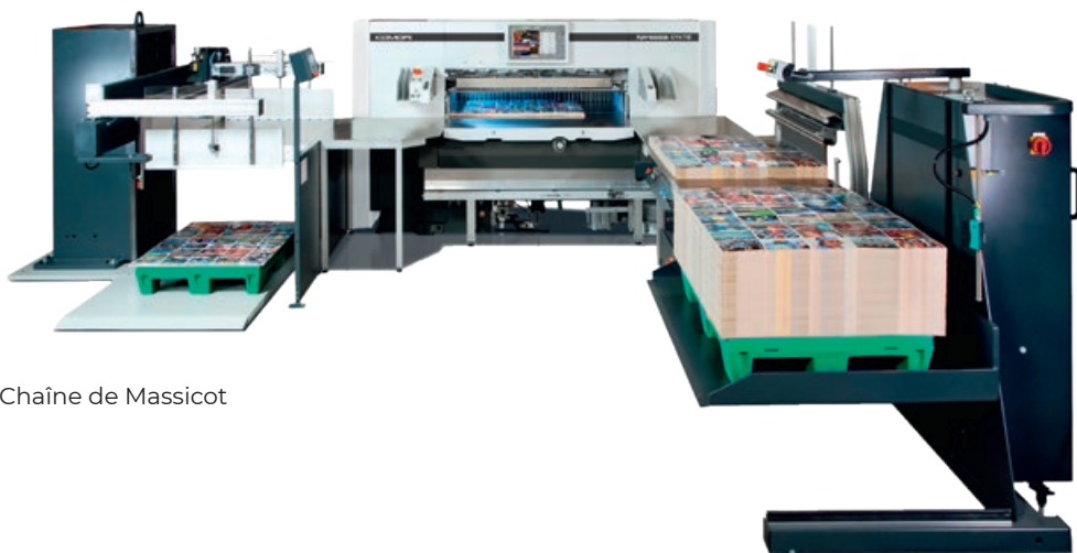
Chaîne de Massicot

Cette ligne de coupe permet une production optimale et la réduction des manipulations pour l'opérateur grâce à sa modularité. Elle offre une précision de coupe et un haut niveau de sécurité.